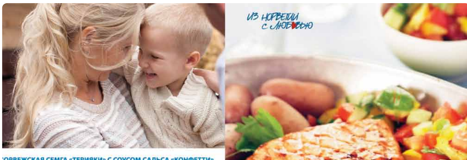
НОРВЕЖСКАЯ СЕМГА «ТЕРЯКИ» С СОУСОМ САЛЬСА «КОНФЕТТИ»

Норвежская сельдь продолжает открываться потребителю с новых сторон в материалах, объединенных концепцией «Удачная партия для любого стола». Помимо появления в имиджевых макетах и адверториалах на страницах «Share», «Women's Health» и других журналов, в мае состоялось участие норвежской сельди в фестивале «Легенды норвежских викингов». Дегустации, конкурсы, призы – всё это открылось посетителям стенда «Путь к сердцу викинга», организованного НКР совместно с брендом А'MORE холдинга РОК-1. Таким образом, НКР открывает новые горизонты сотрудничества с заинтересованными компаниями, к числу которых относится также «Русское море».